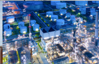
Petróleo y Gas