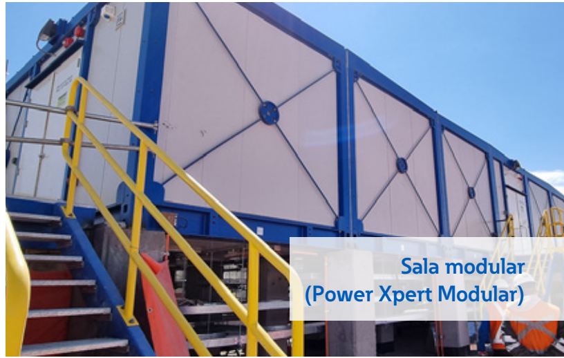
Sala modular (Power Xpert Modular)