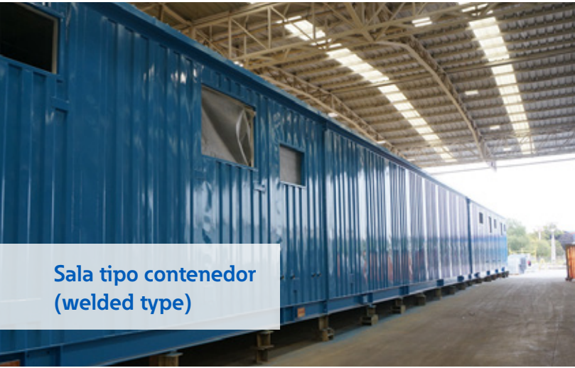
Sala tipo contenedor (welded type)

Una solución integrada para cada necesidad